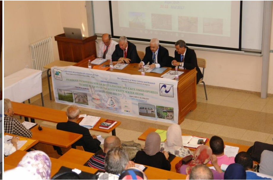
Cérémonie et Mot d'ouverture des JT REUE 2017