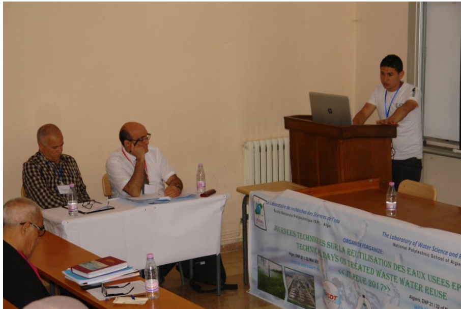
De gauche à droite à Président de séance et Rapporteur Après - Midi