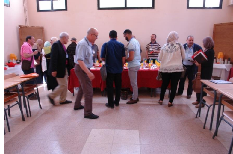
Pose café matinée- Session poster