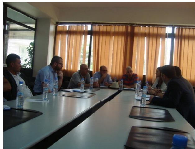
Réunion regroupant le staff de la Station membres du projet irrigatio – participants au JT-REUE 2017.