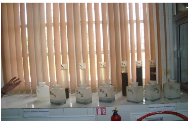
Analyse des boues générées par la station