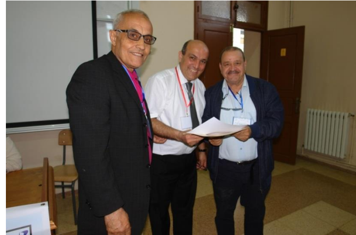
Remise des prix et attestations de participation