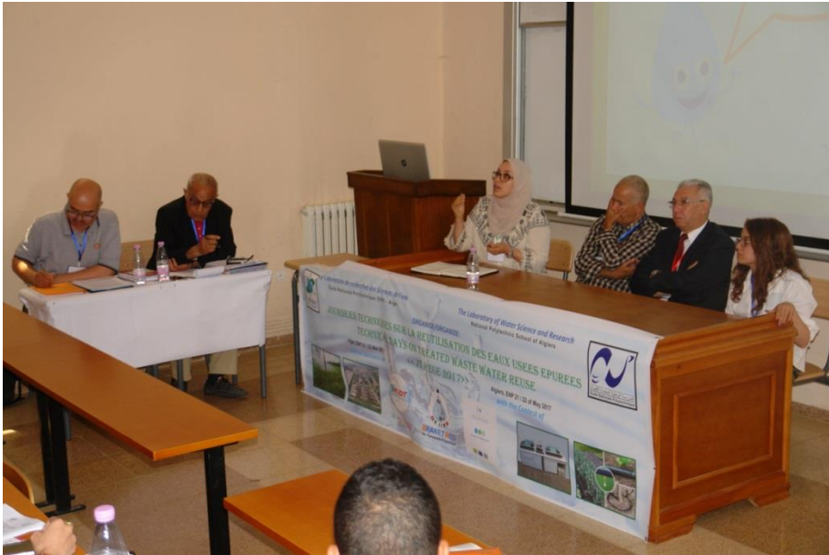
Débat général de la matinée