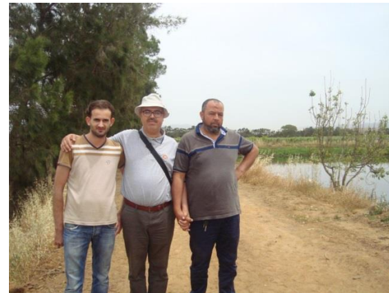
Rencontre avec les agriculteurs partenaires (exploitations Rahmoun et Flici