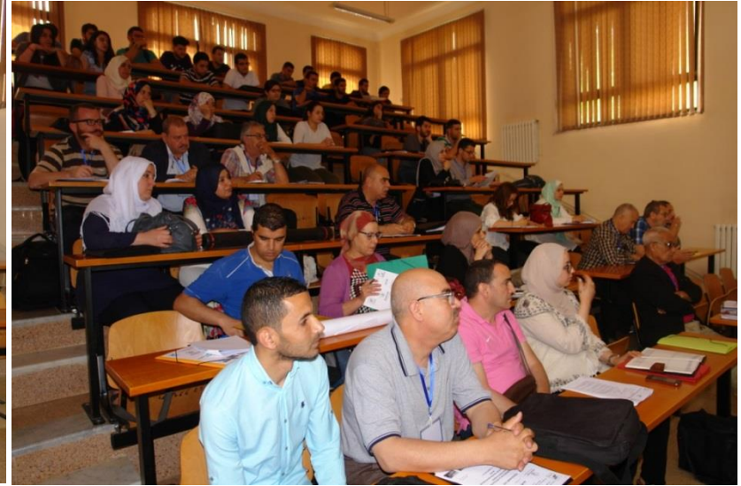
Vue d'ensemble des Participants aux JT REUE 2017