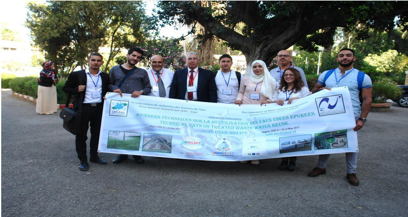
Team algérienne du projet Irrigatio