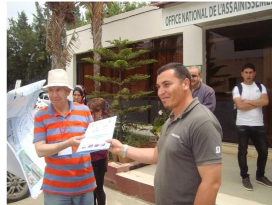
Fin de visite / Photo souvenir de la visite participants –staff station d'épuration de Boumerdes Algérie