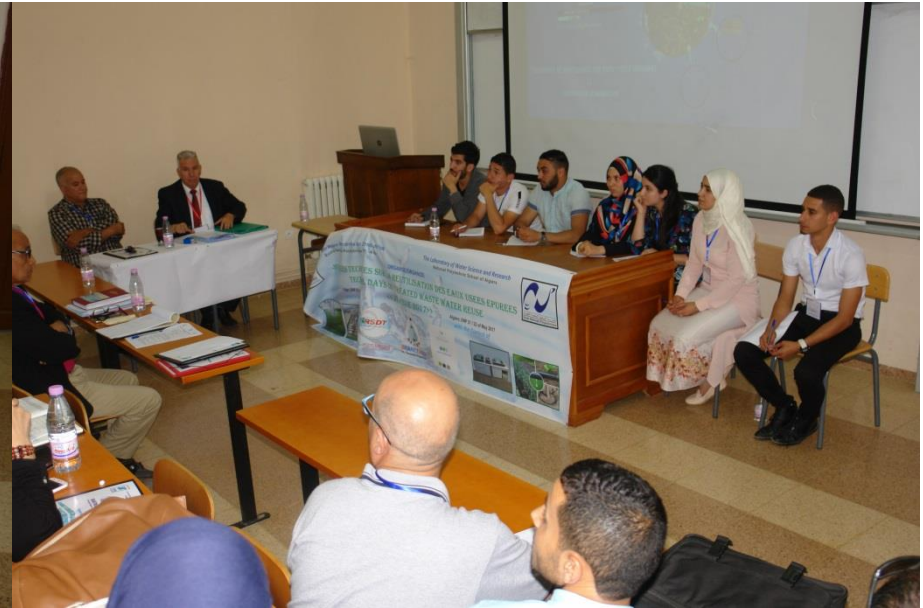
Débat général de l'après- midi