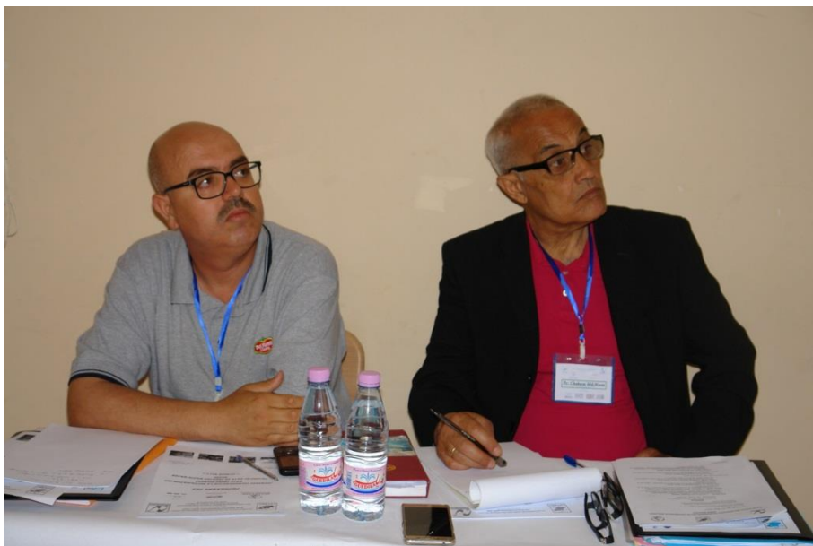
De droite à gauche Président de séance et Rapporteur - Matinée