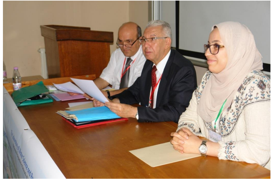
Clôture de la première journée 21 Mai des JT-REUE 2017 - par la remise de prix et divers types d'attestations