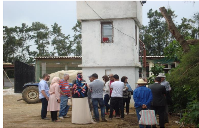
Visite des deux exploitations agricoles pilotes de Corso –Boiumerdes-Algérie (2)