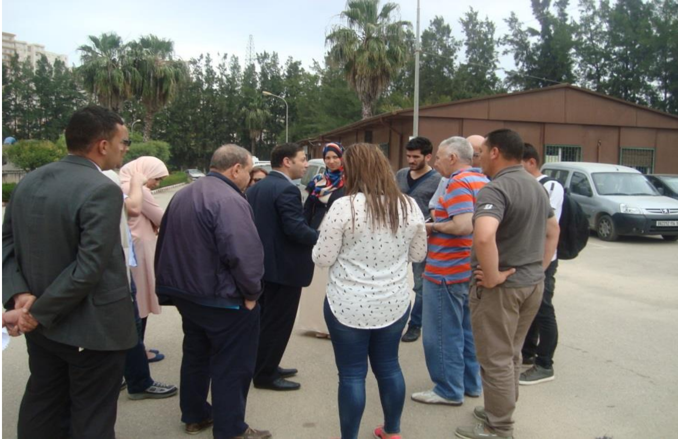
Arrivée des participants à la Station d'épuration de Boumerdes et accueil du staff de la station et à leur tête le Directeur de l'unité ONA (Office Nationale de l'assainissement –Algérie).