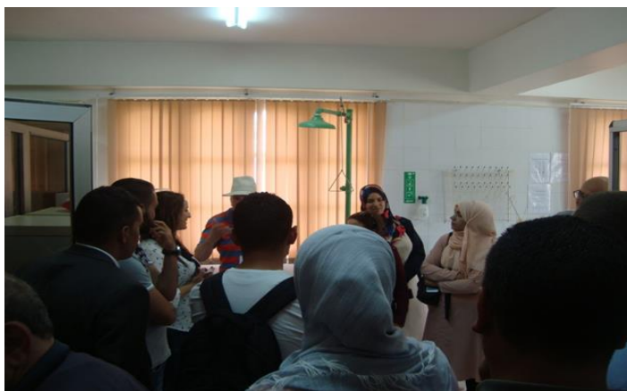
La Directrice du laboratoire présentant le laboratoire d'analyse de la station d'épuration de Boumerdes – Algérie