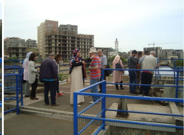
Visite guidées des installations de la station d'épuration de Boumerdes – Algérie.(1)