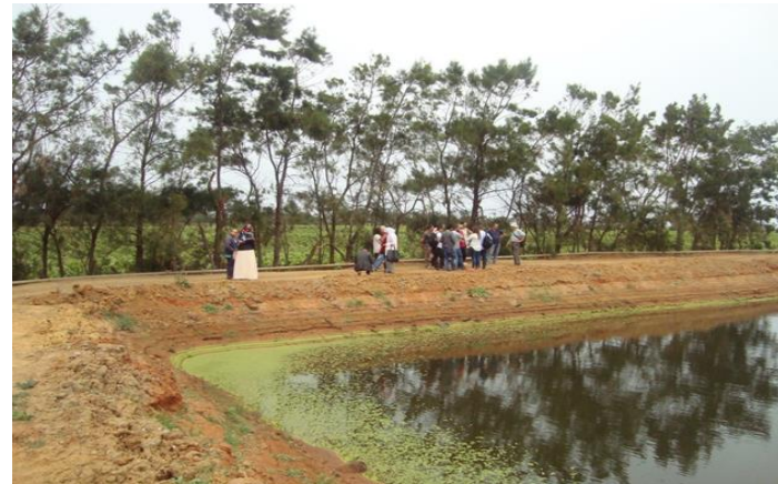
Visite des deux exploitations agricoles pilotes de Corso –Boiumerdes-Algérie (1)