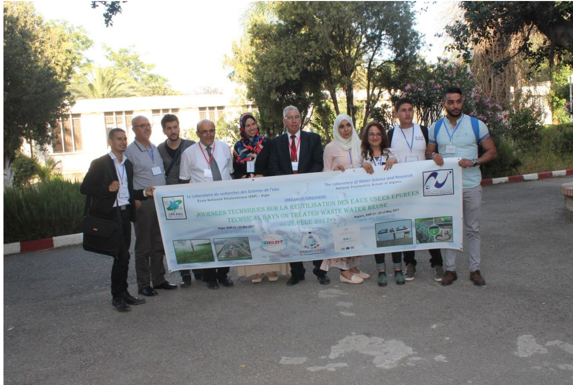
Membres du projet Irrigatio – Algérie