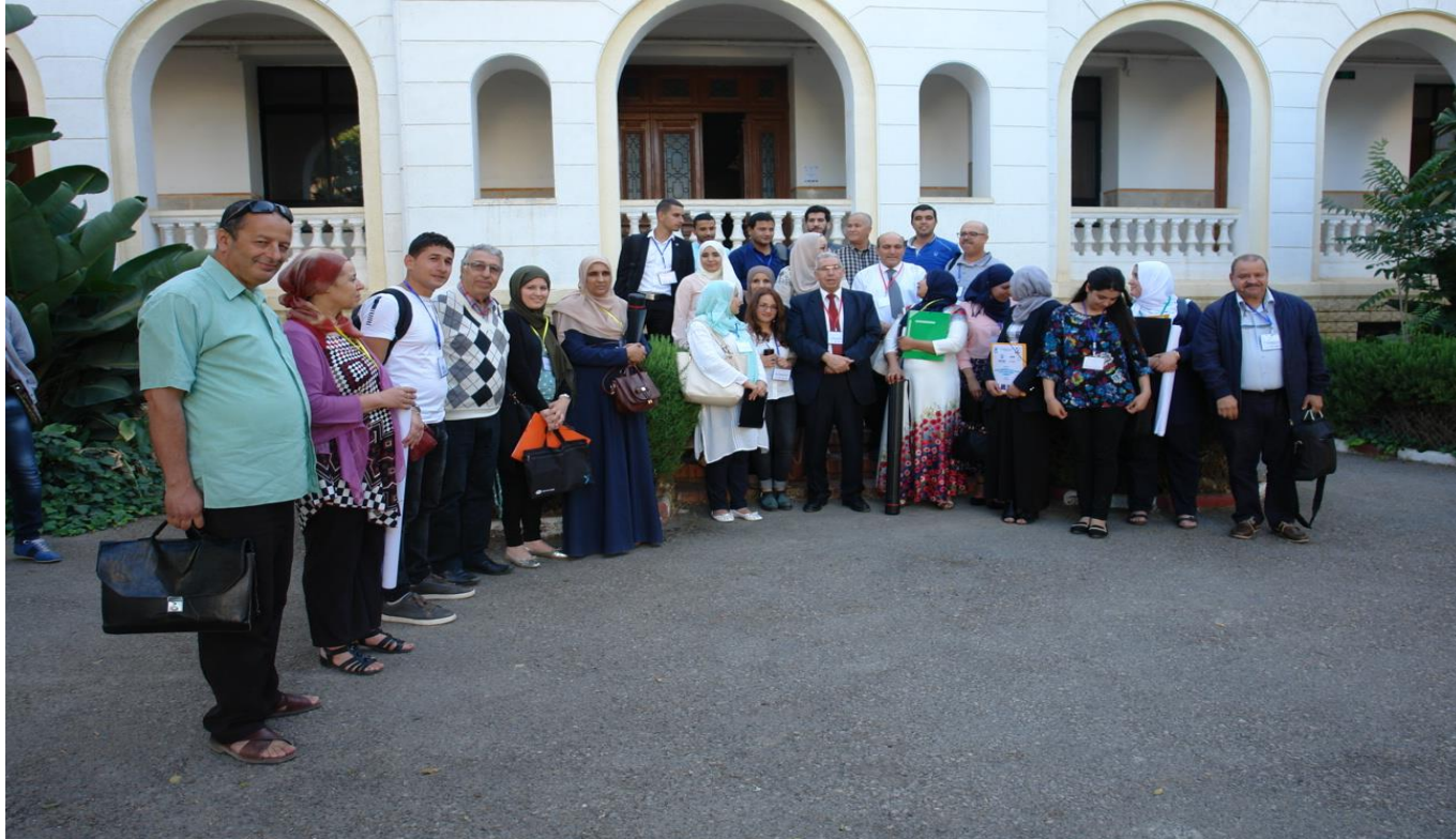
Photo souvenir de l'ensemble des participants à la journée du 21 Mai 2017