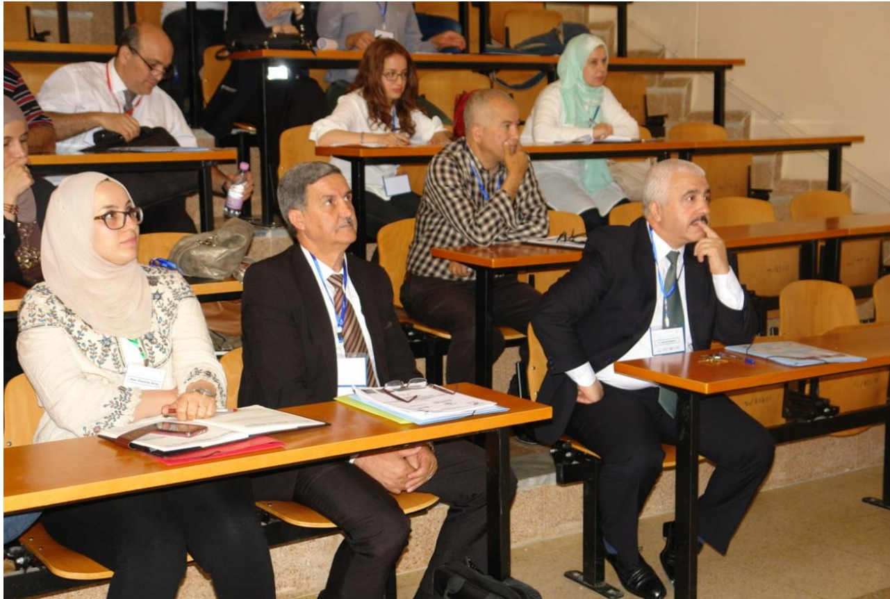
De Gauche à droite Mr le Directeur de l'École Nationale Polytechnique et Mr le Directeur Adjoint de L'ONA