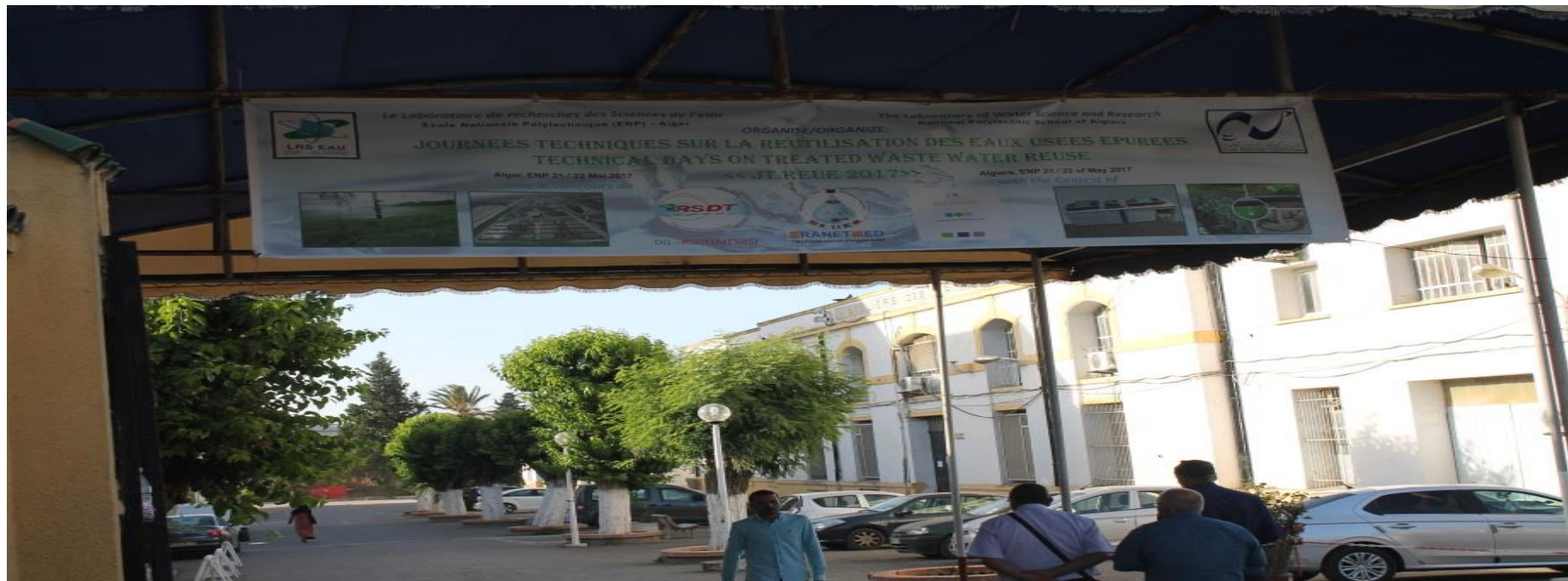
Entrée Ecole Nationale Polytechnique –Algérie – 21 Mai 2017