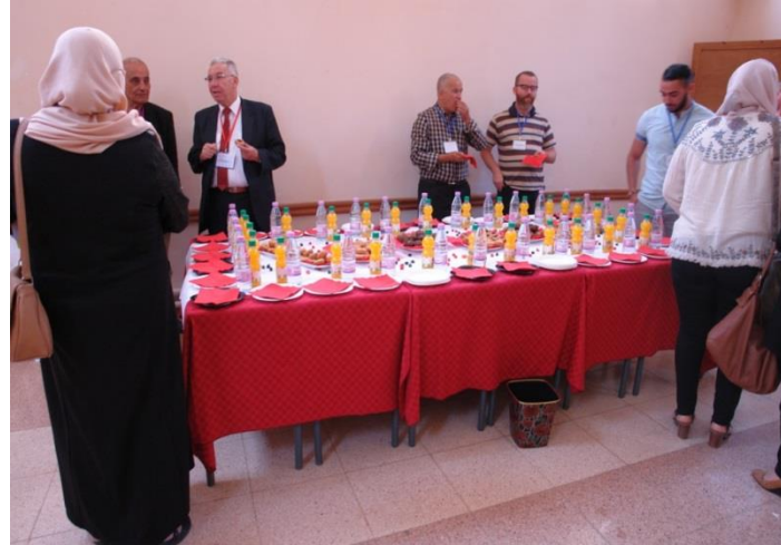
Pose café après midi - Session poster